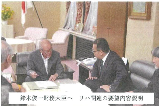
鈴木俊一財務大臣へ リハ関連の要望内容説明