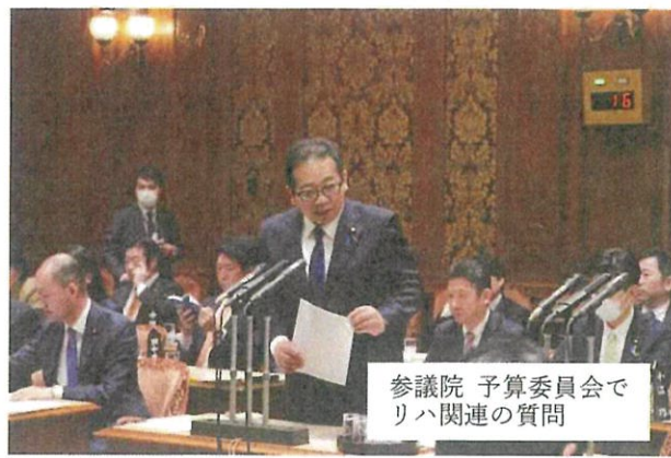
参議院 予算委員会 リハ関連の質問

日本は今、少子高齢化や人口減少が加速し、労働力不足が大きな課題となっています。国の発展と国民生活を安心なものとするため、年金・医療・介護などの社会保障制度を充実し、経済を発展させ、国民の所得を向上することに取り組めます。